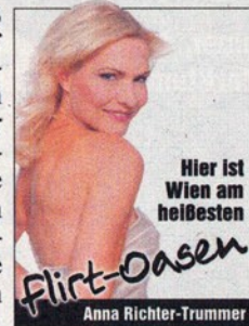
Hier ist Wien am heißesten